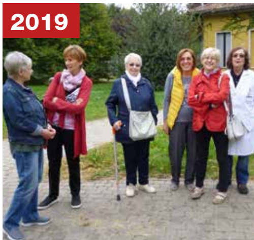
Volontari riuniti per assistere alla piantumazione dell'ulivo donato alla Casa di Riposo, simbolo di pace, prosperità, e longevità.