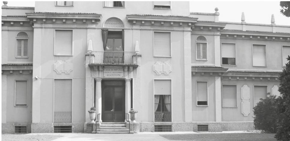
Questa la sede dove abbiamo iniziato il nostro volontariato, l'ex Ospedale della Carità di Lissone

Avo, da settembre alla Casa di riposo Avo, splendida realtà L'Avvo si presenta: a ottobre il primo corso per volontari Avo, corso di formazione