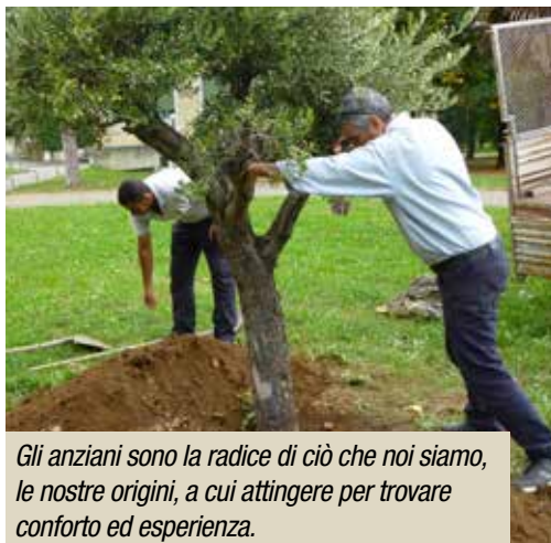
Gli anziani sono la radice di ciò che noi siamo, le nostre origini, a cui attingere per trovare conforto ed esperienza.