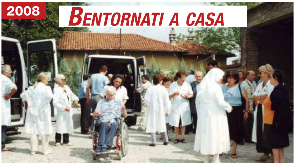
Il grande ritorno a casa dopo il mese trascorso a Merate a Villa dei Cedri a causa della Legionella.