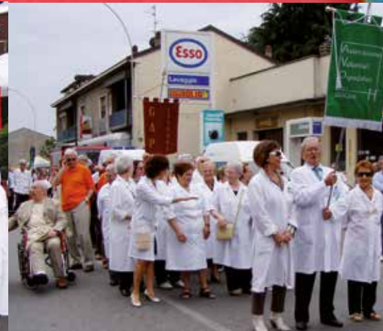
Orgogliosi di appartenere alla famiglia AVO. Tutti insieme con i nostri camici fino a formare una bellissima NUVOLA BIANCA.