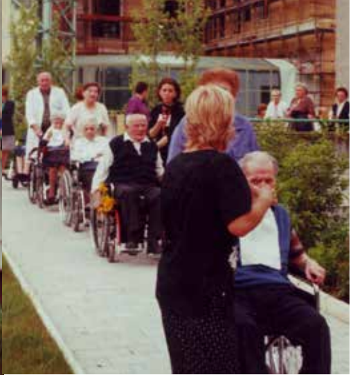
GRANDE FESTA! Addobbi, giochi, gare, competizioni e... Vittoria e soddisfazione della squadra vincitrice delle OLIMPIAVODI 2004.