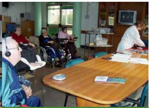
"ASCOLTARE, VEDERE, ESPRIMERSI ..... VIVERE DI PIU'"